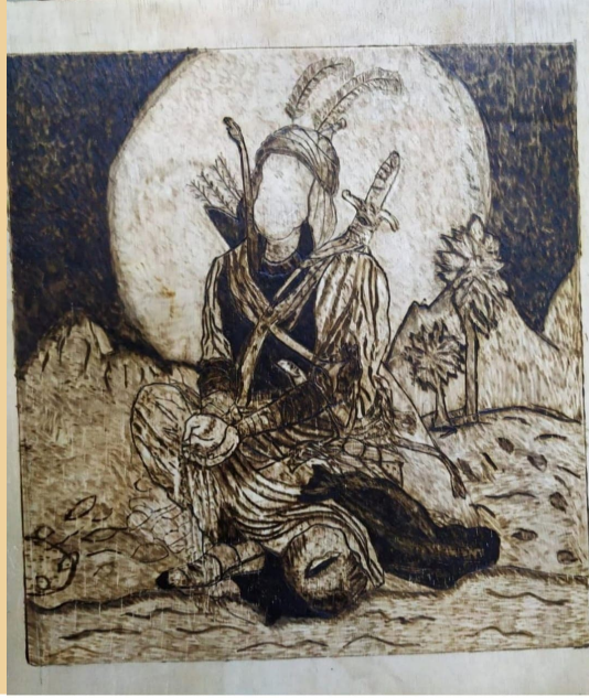
الطالبة : بنين عبدالحسين