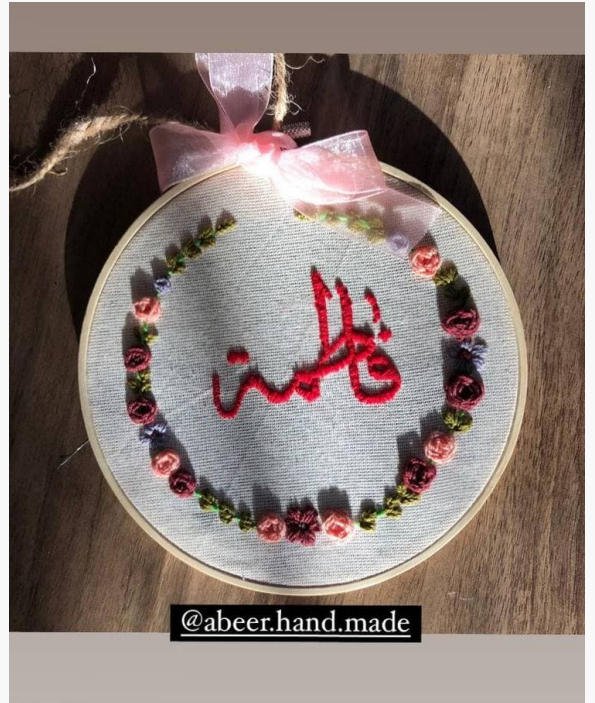
الطالبة : عبير آل طعمة